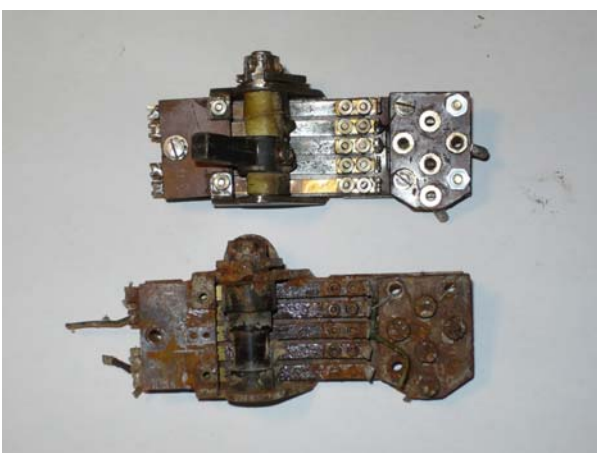
dal basso: prima e dopo la cura di restauro

Tutto questo è la conferma che verso la fine del conflitto alla Germania erano mancate materie prime fondamentali quali rame, alluminio, stagno e componenti tecnologici; si spiegano così le varianti apportate, il peso non era un problema in quanto si trattava di impiego terrestre. Durante la fase di controllo dei componenti recuperati sono comunque rimasto meravigliato dalla qualità degli stessi. Ho trovato difettosi: un quarzo, un trasformatore di media e un solo condensatore di by-pass. Quando si è trattato di tarare il ricevitore ho dovuto disattivare alcuni trimmer