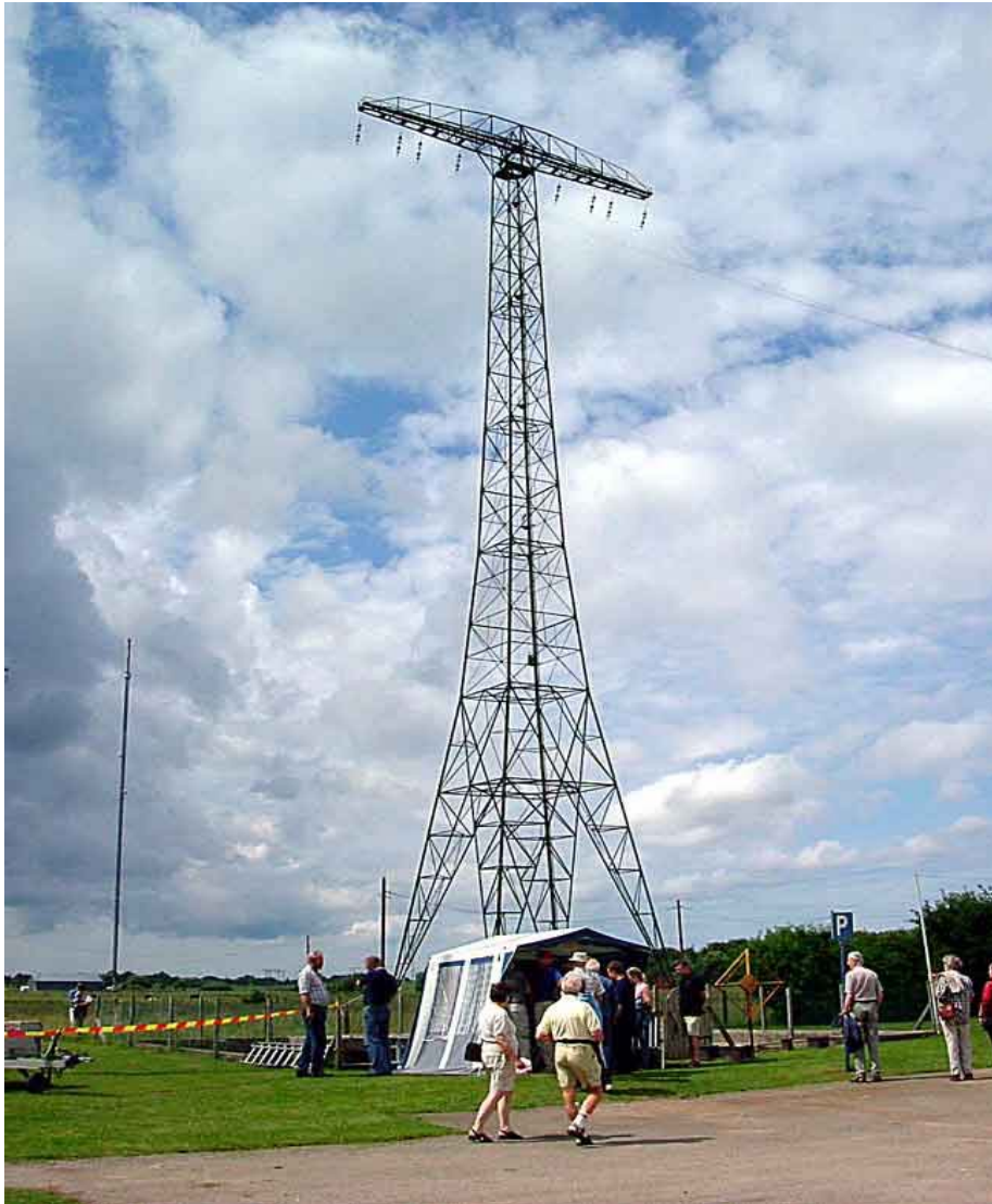
una delle sei torri-antenna alte 127 metri

SAQ sarà "on air" in occasione dell' "Alexanderson Day" il giorno 4 luglio 2010 alle 09.00 UTC ed alle 12.00 UTC sulla frequenza di 17,2 kHz con preparativi alla trasmissione almeno mezzora prima degli orari di inizio riportati. I rapporti di ascolto saranno confermati con cartolina QSL. Per chi non avesse ricevitori per questa frequenza, è possibile ascoltare la trasmissione utilizzando l'opportunità offerta da http://websdr.pa3weg.nl/ Inoltre sarà attiva una stazione di radioamatore, sempre in occasione della ricorrenza, con il nominativo SK6SAQ dalle ore 9.15 alle ore 11.30 UTC e dalle ore 12.15 alle ore 13.00 UTC sulle frequenze 14035 kHz CW – 14215 kHz SSB ed a partire dalle ore 7.00 UTC anche su 3755 kHz SSB . Per i QSO con SK6SAQ la QSL è via SK6DK oppure diretta a: ALEXANDER Grimeton Veteranradios Vänner Radiostationen – Grimeton 72 – S 430 16 Rolfstorp (Sweden). Nel caso degli ascolti di SAQ i rapporti possono essere inoltrati oltre